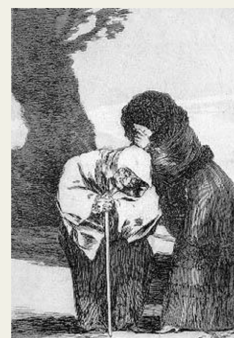
Fig. 3: Un Capricho, «El Chitón» (1799)

La enfermedad de Scheuermann afecta sobretodo juveniles. Es probable, por tanto, que los dibujos no representen esa enfermedad (todavía, no es posible excluir la posibilidad de una cifosis persistente que comenzó en la niñez debido a la enfermedad de Scheuermann (4) ). Un evento traumático también no puede ser descartado. Casi 3% de los casos de tuberculosis de la espina desarrollan una deformidad cifótica grave. No obstante, ese riesgo se limita usualmente aquellos que tuvieron la enfermedad con menos de diez años. Además, provoca normalmente una paraplejía (6) – no es el caso de las mujeres representadas (o uso de la muleta supone la locomoción).