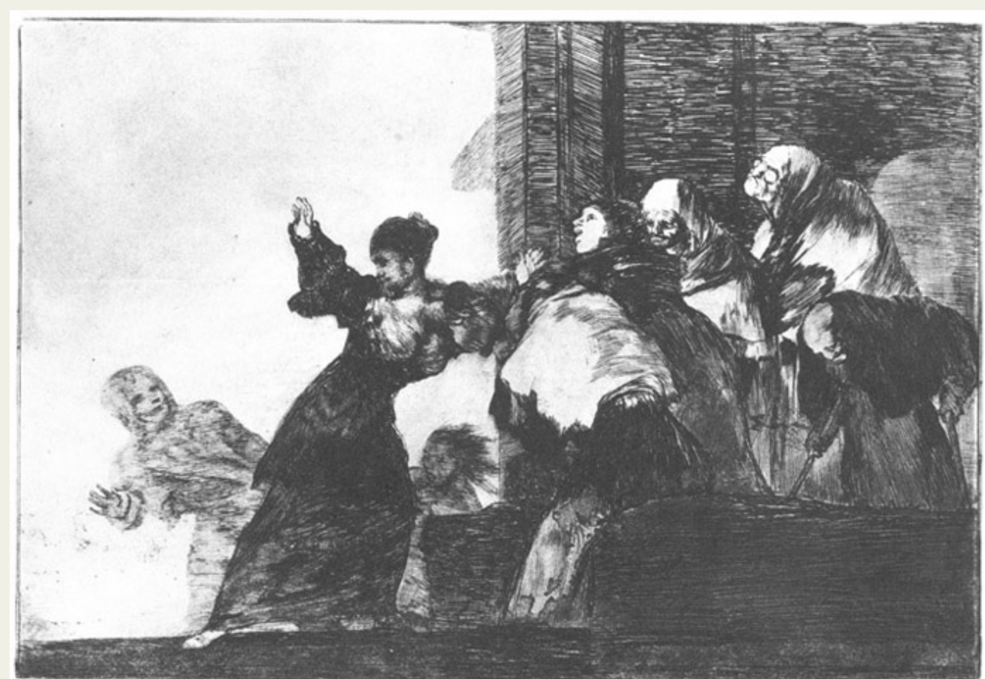
Fig. 1: «Disparate pobre» (1819-23)

En este trabajo se analizan tres dibujos de Goya en que están representadas mujeres ancianas y curvadas e se refleja acerca de las condiciones patológicas que pueden originar la cifosis de la columna vertebral de las mujeres figuradas.