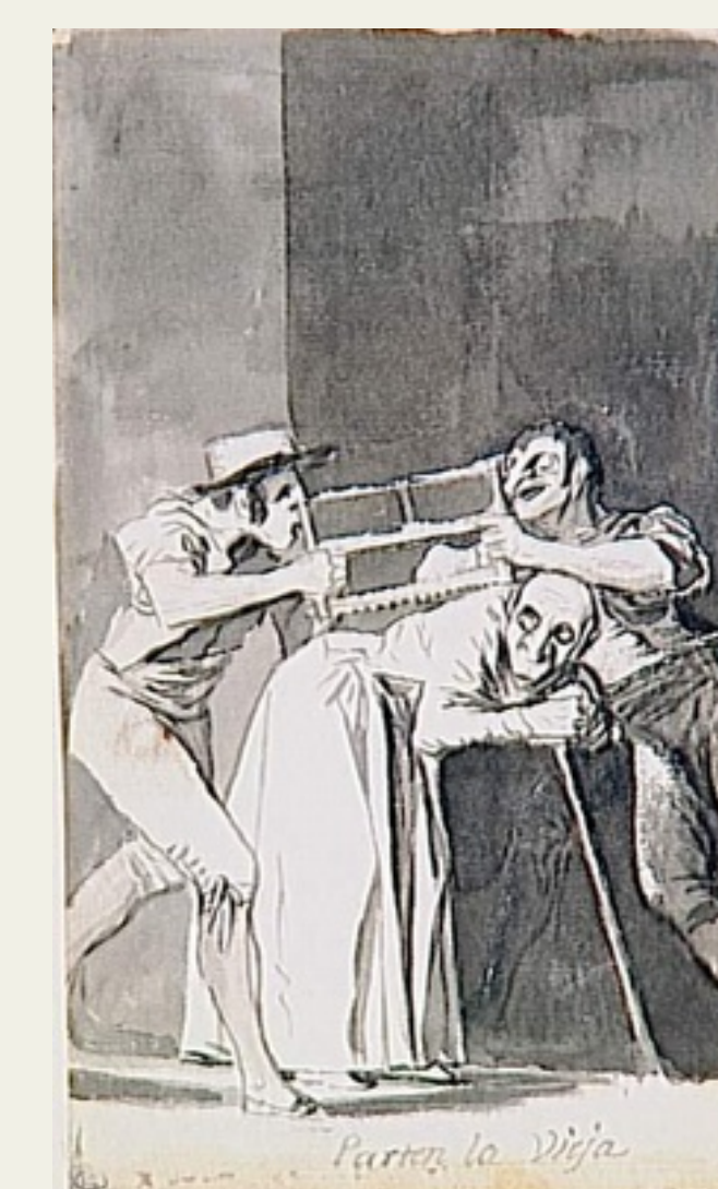
Fig. 2: «Parten la vieja»

En ancianos, la curvatura de la espalda resulta muchas veces de espondilosis torácica (osteoartritis), o osteoporosis espinal (4,5) . La Fig. 2 puede representar una mujer con estenosis espinal (una consecuencia tardía de la osteoartritis espinal, acondroplasia o DISH (5) ) – o el uso del bastón y la posición encorvada es típica. Puede ser también una manifestación clínica de osteoporosis espinal, tal como en la Fig. 4. Los dibujos presentan también diversas características consistentes con el diagnóstico de osteoporosis espinal: tronco corto relativamente a la extensión de los miembros inferiores, espalda encorvada, uso del bastón de apoyo y vejez.