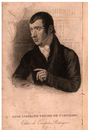
José Liberato Freire de Carvalho, gravura in Memórias da vida de José Liberato Freire de Carvalho anno de 1854 , Lisboa: Tipografia de José Baptista Morando, 1855.

Ainda hoje está por confirmar, de modo definitivo, a participação de José Liberato Freire de Carvalho (1772-1855) na vida do jornal londrino Paquete de Portugal , cujos redactores foram Rodrigo da Fonseca Magalhães (1787-1855) e o padre Marcos (Marcos Pinto Soares Vaz Preto, 1782-1851). Com publicação entre 25 de Agosto de 1829 e 16 de Agosto de 1831, o Paquete de Portugal constituiu um dos mais incómodos órgãos da imprensa liberal no exílio, noticiando factos ou rumores da vida diplomática e política do Portugal miguelista que complementam outras fontes do conhecimento histórico da época. Figura heterodoxa do liberalismo português e um dos maiores expoentes do jornalismo político de língua portuguesa do início do século XIX, José Liberato encarna uma cosmovisão singular do seu tempo, que nunca perde actualidade nem vigor.