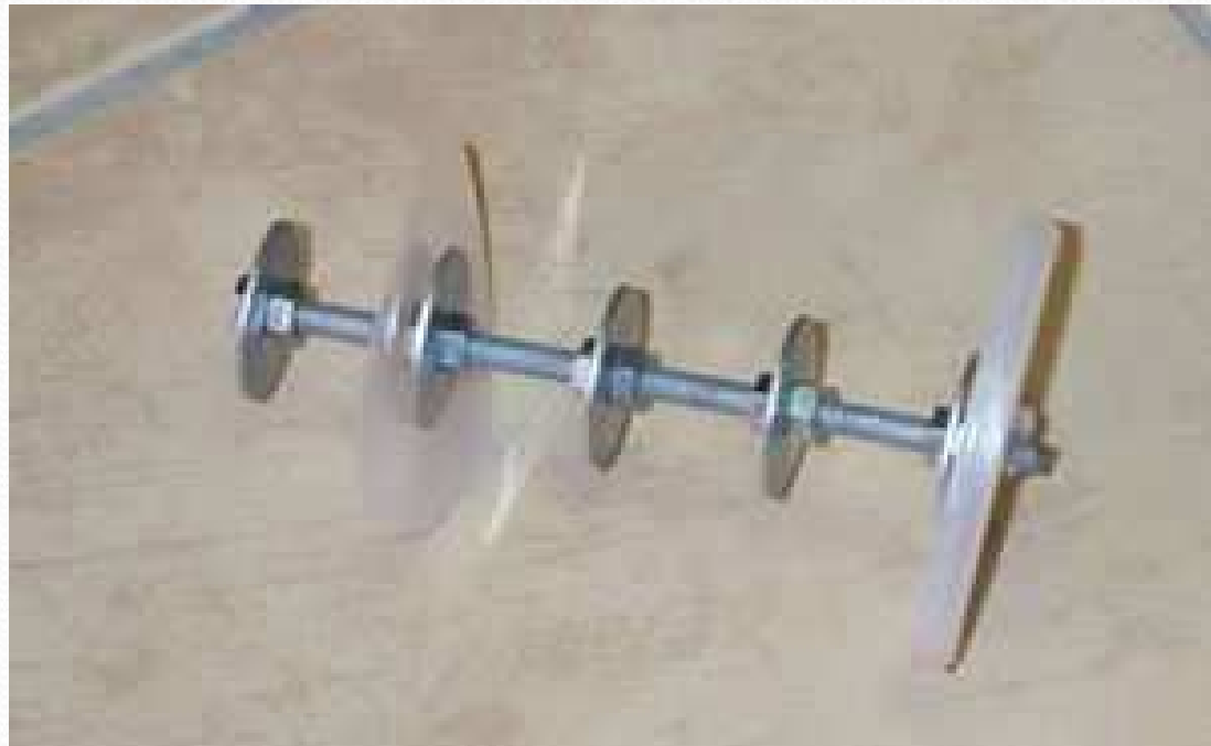
Foto do eixo montado

Para uma boa qualidade no sinal os espaços entre as rodela são equidistantes;