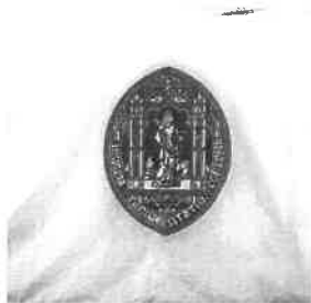
Bandeira da Universidade de Coimbra.