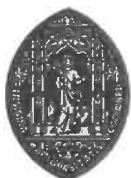
Selo da Universidade de Coimbra.