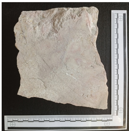
FIG. 2 – A face posterior da epígrafe.