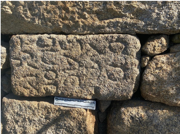
FIG. 2 – Face anterior do altar com o texto inciso.