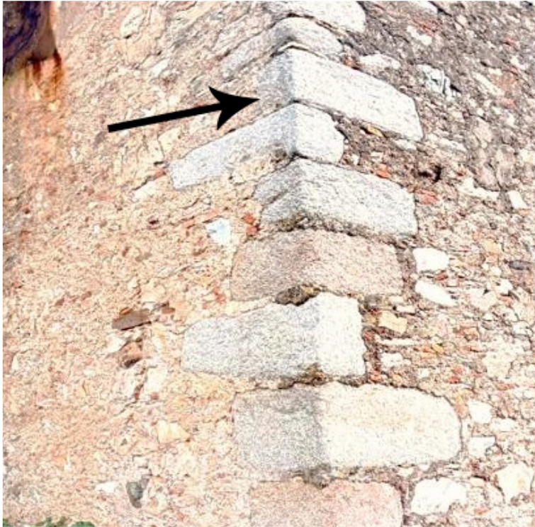
FIG. 1 – Ubicación de la inscripción.