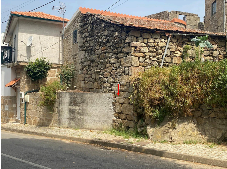
FIG. 1 – Perspetiva do reaproveitamento da inscrição como material de construção.