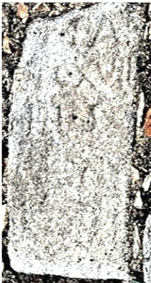
FIG. 2 – La inscripción.