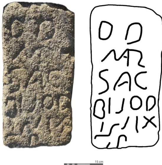
FIG. 4 – Registos fotográfico e desenhado do texto da epígrafe (fotografia e desenho: R. Mendes).