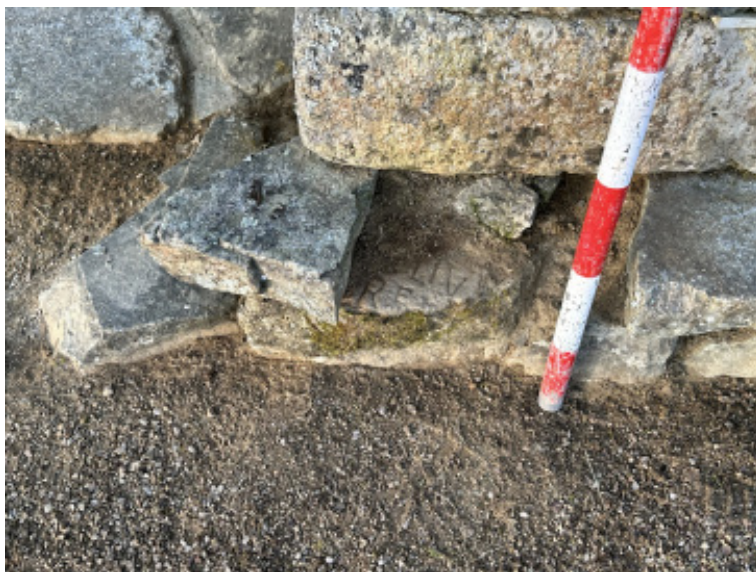
FIG. 1 – Altar de Némesis de A Ciadella, dentro del muro.