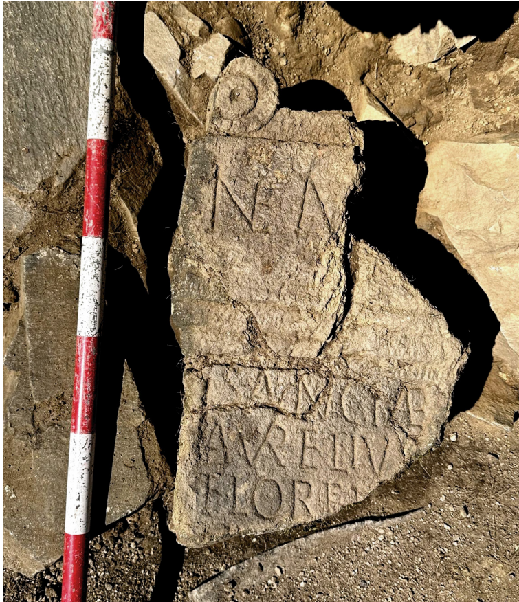
Fig. 2 – Altar de Némesis de A Ciadella en el lugar del hallazgo.