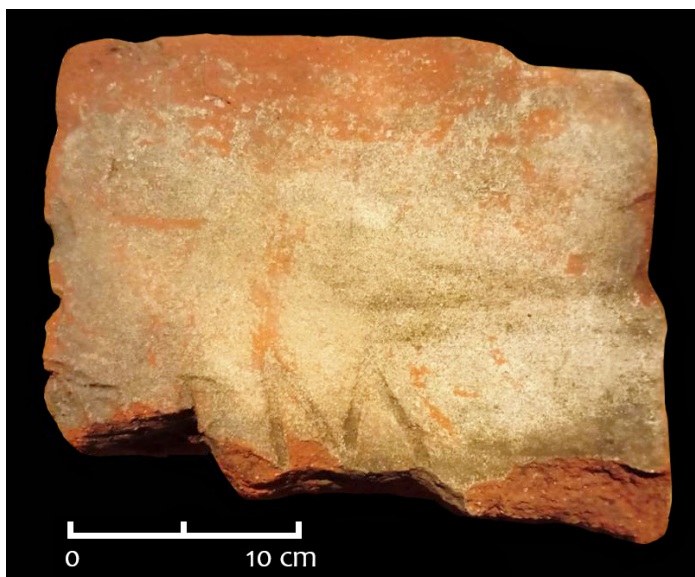
FIG. 2 – Foto da inscrição do later.