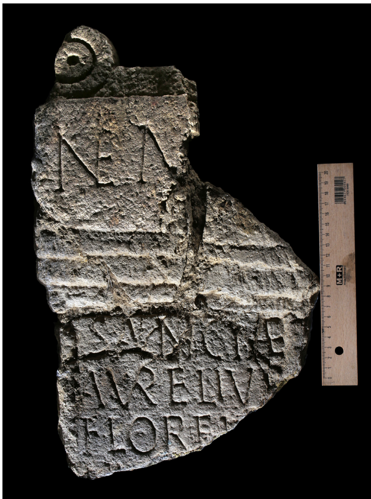
FIG. 3 – Altar de Némesis de A Ciadella. Fotografía: J. M. Salgado (Fundación L. Monteagudo), 2024.