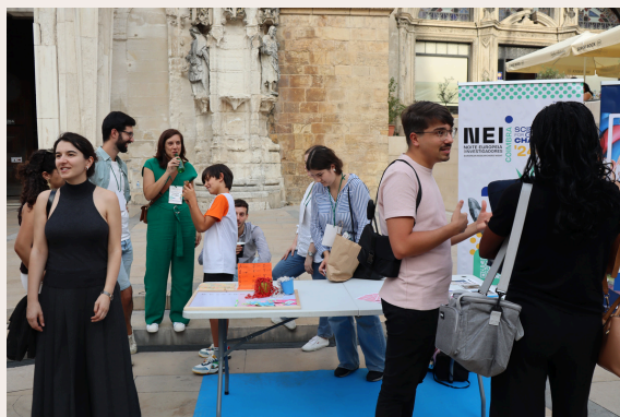
Sexta da Ciência e Noite Europeia dos Investigadores

O II encontro do IJ reuniu investigadores e investigadoras para repensar estratégias, atividades a implementar e reforçar o espírito de equipa. Este evento anual decorreu no dia 10 de setembro, no Colégio da Trindade, e contou com vários momentos de partilha e trabalho conjuntos.