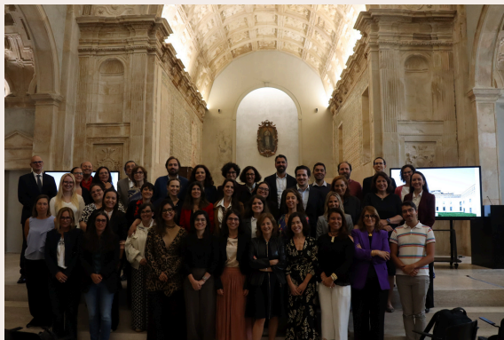
Encontro anual do IJ

O II encontro do IJ reuniu investigadores e investigadoras para repensar estratégias, atividades a implementar e reforçar o espírito de equipa. Este evento anual decorreu no dia 10 de setembro, no Colégio da Trindade, e contou com vários momentos de partilha e trabalho conjuntos.